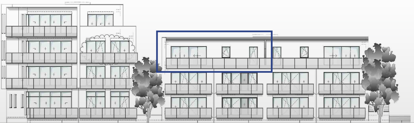
Ansicht von Westen