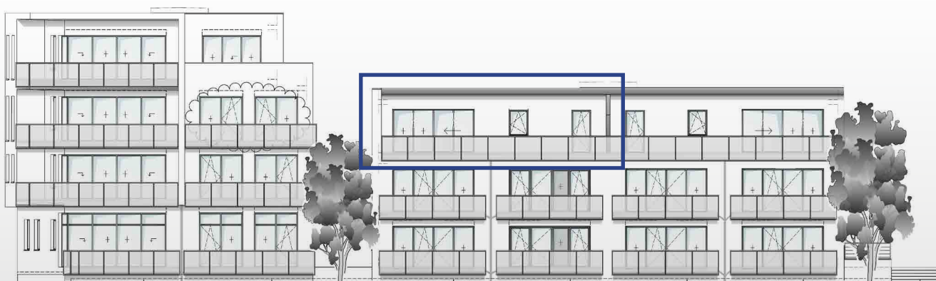
Ansicht von Westen